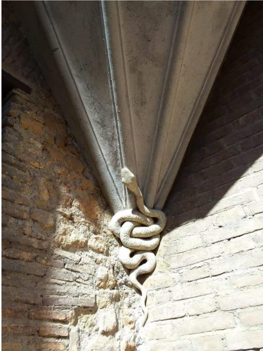
1. Serpente , esterno della Casina delle Civette, lato Nord-Ovest, pietra scolpita, inizio sec. XX