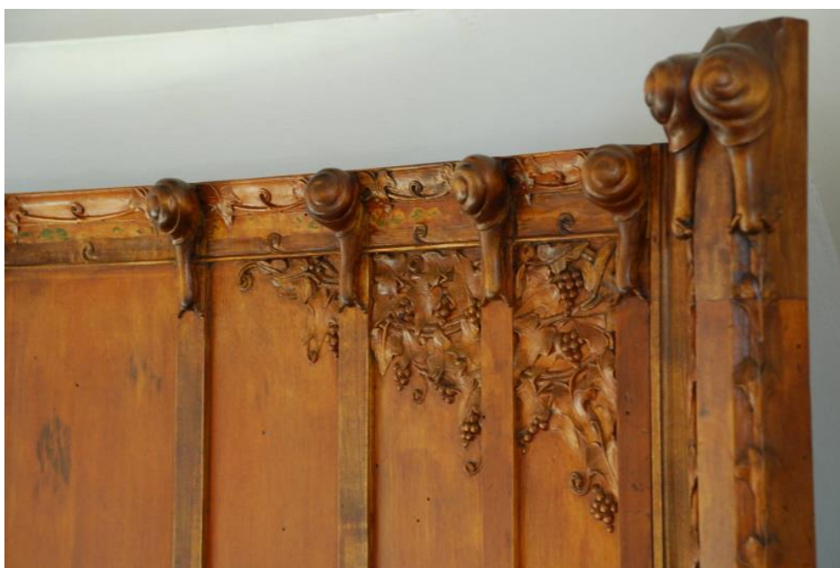
1. Stanza dei Satiri, particolare della panca, legno intagliato, inizio sec. XX

Quali saranno gli altri animali nascosti nelle decorazioni della Casina delle Civette? Pronti a scoprirlo nei prossimi episodi?