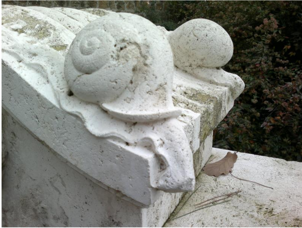
2. Esterno della Casina delle Civette, particolare della ringhiera, travertino, inizio sec. XX