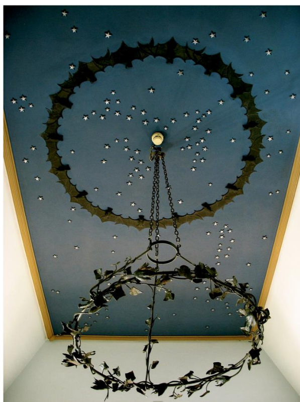
Stanza da letto del Principe, particolare del soffitto, inizio sec. XX